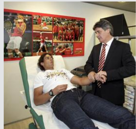
Rafa Nadal en una visita a la Clínica MAPFRE de Medicina del Tenis,